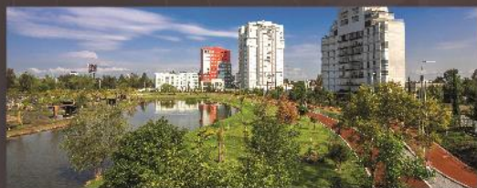
Parque del Arte